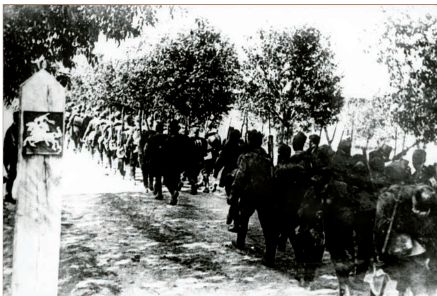
Raudonosios armijos kariai kerta SSRS-Lietuvos sieną, 1940 m. birželio 15 d.

Kremliaus tuometinės ekspansinės politikos gairės aiškiai atskleistos Raudonosios armijos politinės valdybos direktyvoje Nr. 5258ss: „Mūsų užduotis aiški. Mes norime užtikrinti SSRS saugumą, stiprių užraktu uždaryti iš jūros priėjimus prie Leningrado, mūsų šiaurės–rytų sienas. Per Estijos, Latvijos ir Lietuvos antiliaudiškų klikų galvas mes įvykdysime mūsų istorinius uždavinius ir kartu padėsime šių šalių darbo liaudžiai išsivaduoti. (...) Lietuva, Estija ir Latvija taps sovietiniu forpostu ant mūsų jūrų ir sausumos sienų. Pasiruošimas puolimui turi būti visiškoje paslapyje. (...) Reikės greitai suardyti priešą armiją, demoralizuoti užnugarį ir tokiu būdu padėti Raudonosios armijos vadovybei per trumpiausią laiką ir su mažiausiomis aukomis pasiekti visiškos pergalės“.