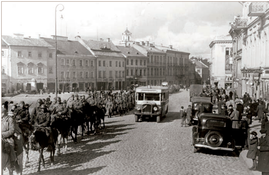
Raudonosios armijos karių kolona Vilniuje. 1939 m. rugsėjo mėn.

visos jos gerokai išgąsdintos. 1939 m. rugsėjo mėn. pabaigoje Baltijos šalių pasienyje Sovietų Sąjungos buvo sutelkta 437 235 kariai, 3 052 tankai ir 3 635 artilerijos pabūklai.